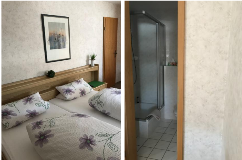
Doppelzimmer, Badezimmer mit Dusche und WC Normalpreis: 30,-- Euro/Person